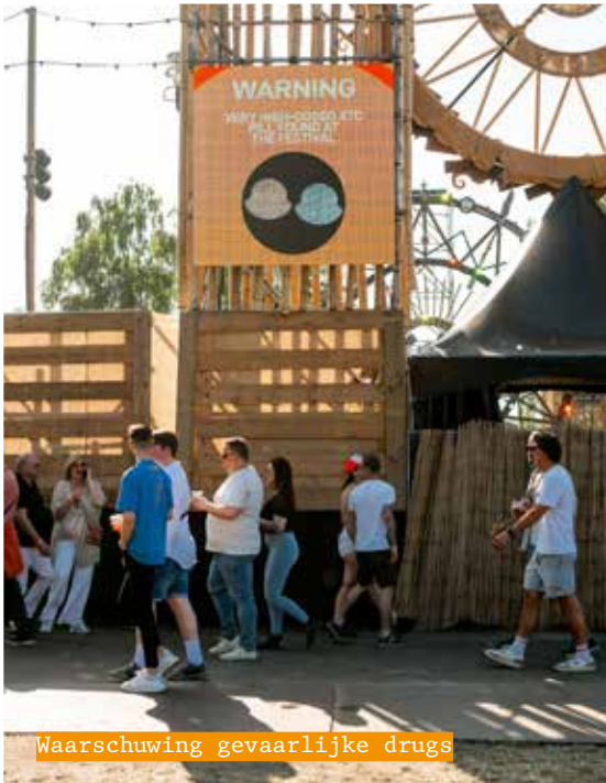
Waarschuwing gevaarlijke drugs