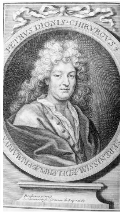
Pierre Dionis gravure