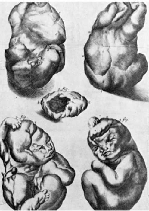
Lithopedion van Toulouse