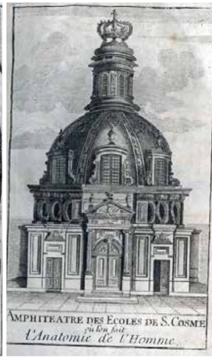
Theatrum anatomicum van Dionis