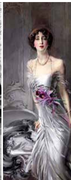
Madame Doyen door Giovanni Boldini 1910