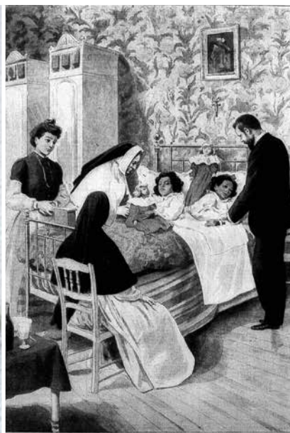
Radica en Doodica na scheiding