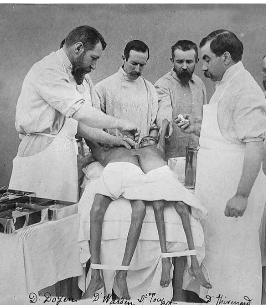
Doyen scheidt de tweeling