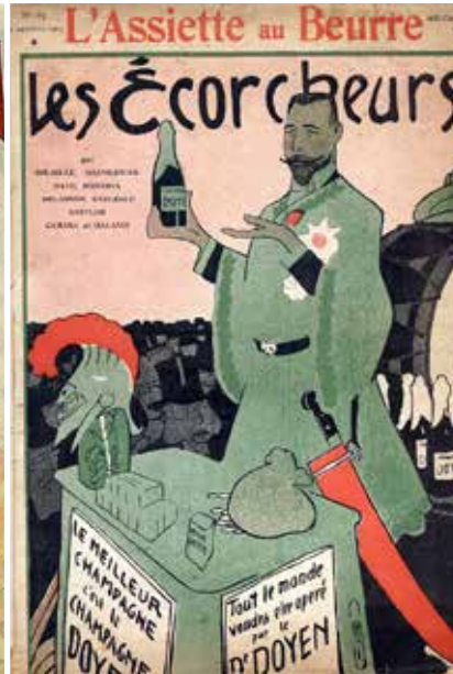
Karikatuur Ecorcheur (vilder)