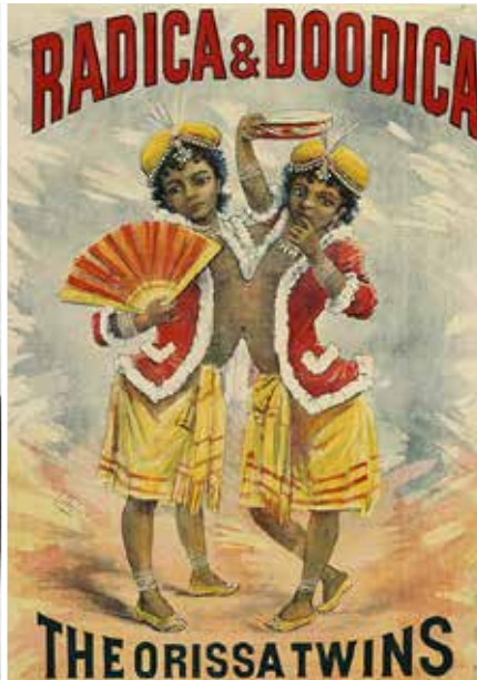
Radica en Doodica affiche Barnum