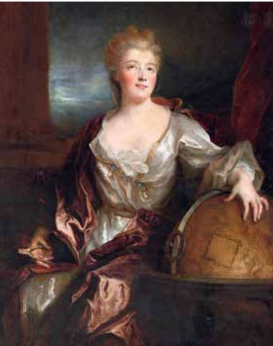
Marquise du chatelet door Nicolas de Largillière