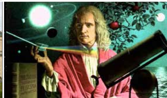
principes mathématiques formules - Isaac Newton experiment