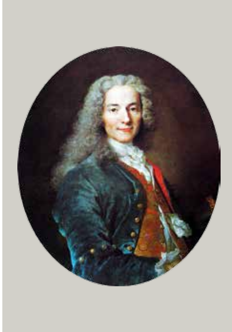
Voltaire door Nicolas de Largillière 1725