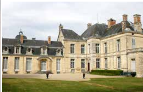
Château Cirey vroeger - Château Cirey vandaag