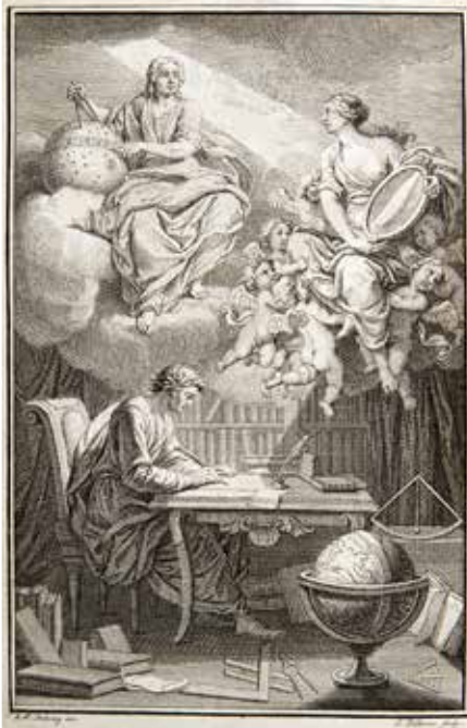
Voltaire Philosophy of Newton frontispiece